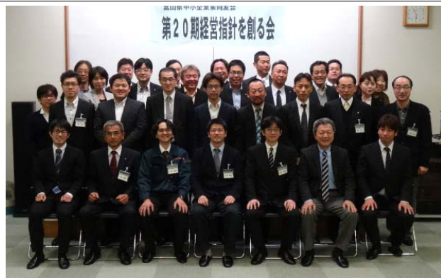
受講者と助言者（受講OB）が半年間関わり合います

30年の節目に貴重な機会を得た事に対し、感謝申し上げます。これから指針を大切にとらえ、実践していくことが大事になります。みんなの共有できるものとして励んでいきます。