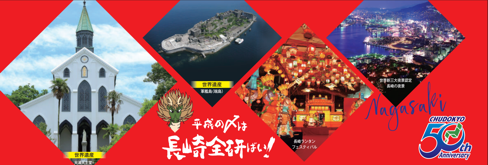
世界遺産 大浦天主堂